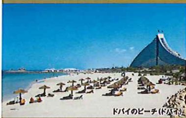
ドバイのビーチ(ドバイ)