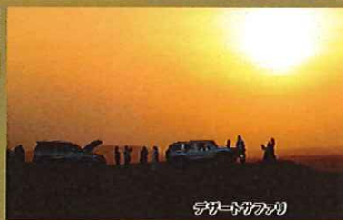
デザートサファリ