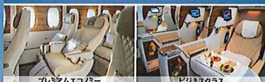
プレミアムエコノミー