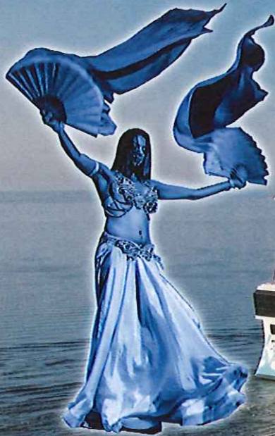
ベリーダンスイメージ