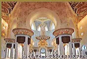
シェイク・ザイド・グランドモスク(アブダビ)